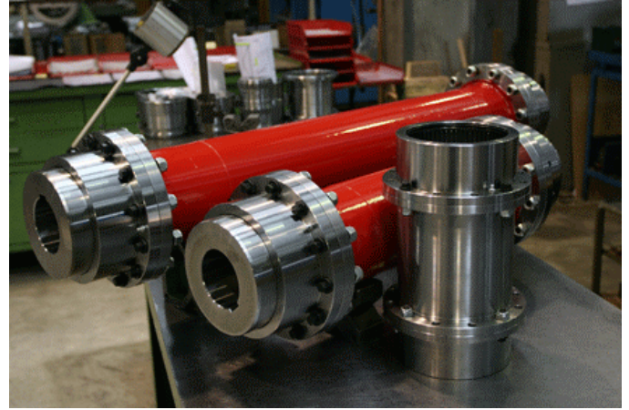
Allunghe tipo AO-A

Grazie al Ns. fornitissimo magazzino siamo in grado di consegnare dal pronto a prezzi competitivi.