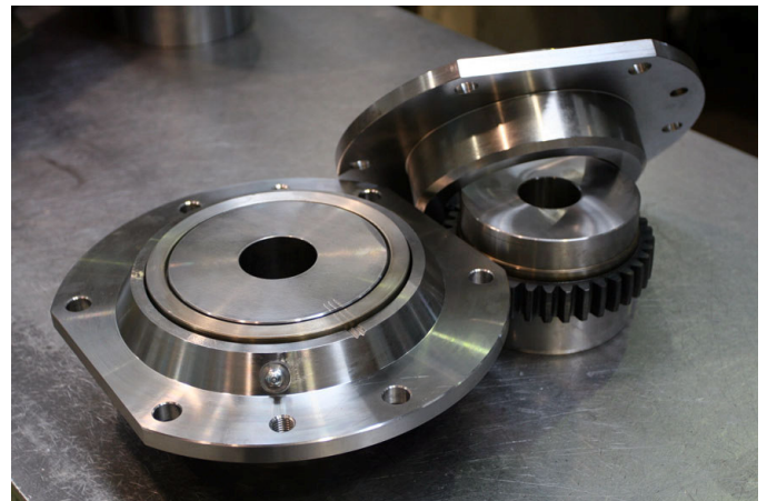
Giunti per sollevamento GTS